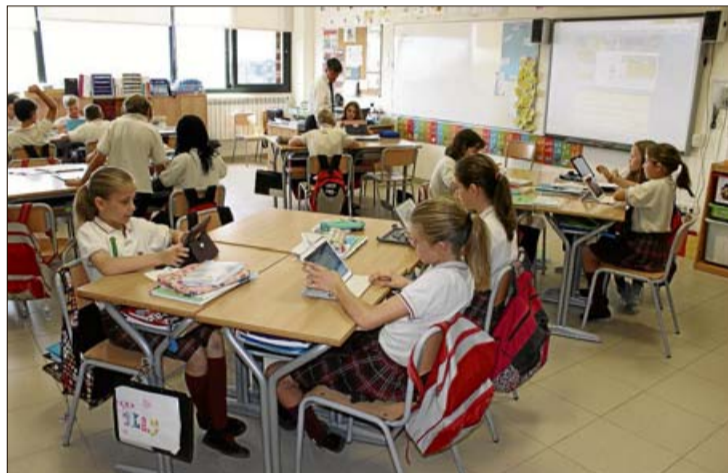
Los alumnos trabajan con tablets individuales en clase.