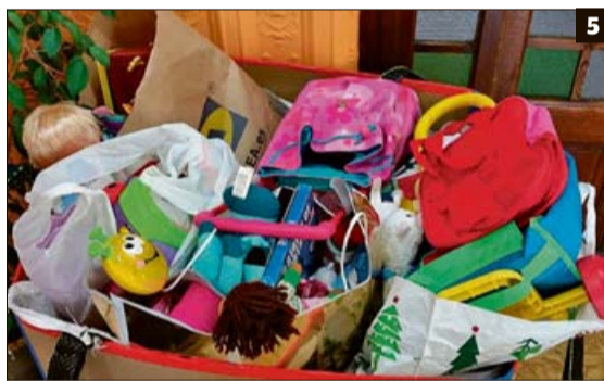
▶ ELS CENTRES EDUCATIUS CELEBREN LA PAU 1 L'espiral del col·legi Sagrat Cor. 2 SAGRAT COR 2 Alumnes del Bisbe Verger i Blai Bonet de Santanyí. 3 BISBE VERGER 3 L'escoleta de Sant Josep Obrer i del Corpus Christi. 4 SJO 4 Comemoració al CEIP Jaume I de Palmanova. 5 JAUME I 5 El CEI Pinocho recollí juguetes. © ECEI PINOCHO