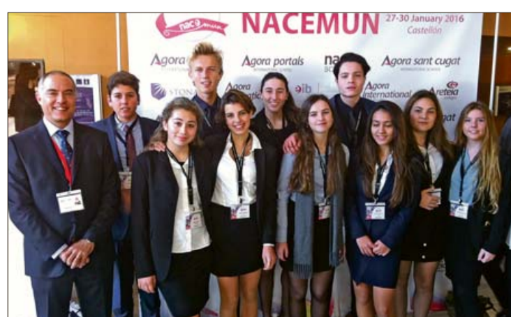
Els alumnes participants a NACE MUN.

Els estudiants, com a autèntics delegats diplomàtics, represen-