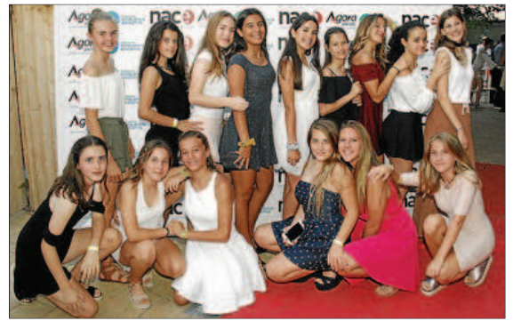
Ellas lucieron elegantes vestidos y posaron a su llegada en el 'photocall'.

No faltó ni la alfombra roja, ni el photocall ni la entrega final de premios. Alrededor de 400 alumnos de ESO y de Bachiller del colegio Ágora Portals celebraron ayer el baile de fin de curso siguiendo los cánones norteamericanos. Ellas, vestidas de largo; ellos, elegantes (sin zapatillas ni vaqueros). La fiesta de fin de curso comenzó pasadas las 19.30 horas en la entrada del colegio. Tras hacerse las fotos de rigor y obtener cada uno de ellos una pulsera —en la que constaba un número y el curso al que pertenecían—, los estudiantes se trasladaron después al pabellón deportivo, convertido para la ocasión en un salón de baile, decorado con globos y telas en tonos negros y dorados.